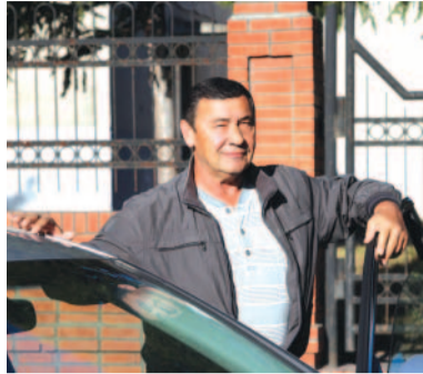
Более 30 лет - стаж работы опытного водителя.

После этого водитель получает задание и отправляется в путь. Сегодня это может быть поездка в Крутинский район Омской области, завтра - сопровождение по частному городскому сектору, послезавтра - визит на предприятия Омского, Калачинского, Кормиловского районов. Поскольку компания занимается реализацией природного